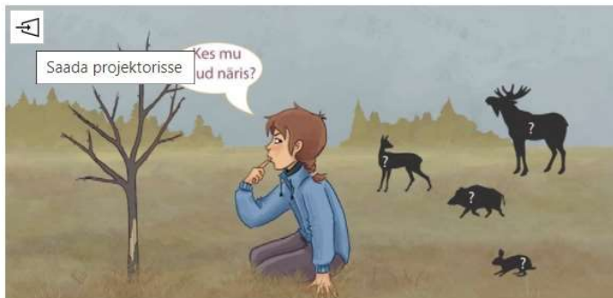
Mari ja nâritud õunapuud

Distantsõppe puhul on õpetajal selleks vajalik lisakuvar – nii on esmane ekraan, millel on avatud kogu konspekt, nt õpetaja sülearvuti, ja õpilastega jagatav, teine ekraan sellega ühendatud kuvar.