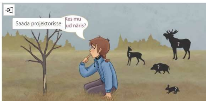
Mari ja näritud õunapuu

Distantsõppe puhul on õpetajal selleks vajalik lisakuvar – nii on esmane ekraan, millel on avatud kogu konspekt, nt õpetaja sülearvuti, ja õpilastega jagatav, teine ekraan sellega ühendatud kuvar.